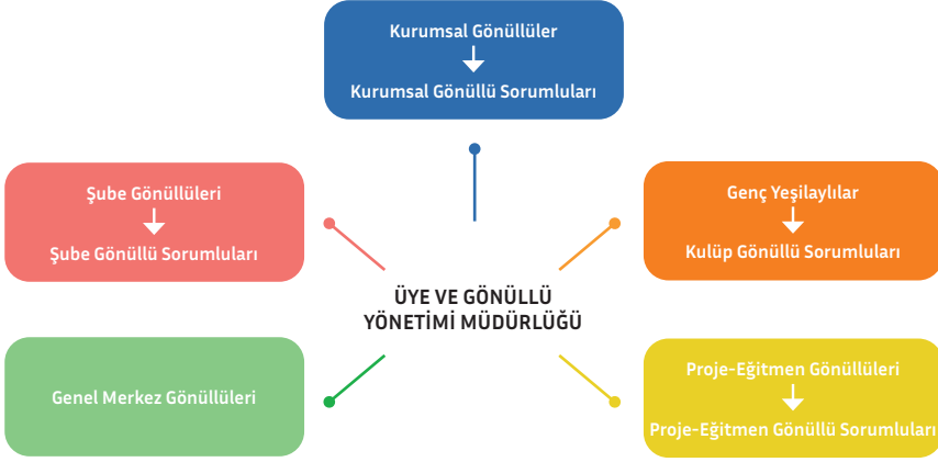
GÖNÜLLÜ SORUMLULARI YAPISI

Farklı gönüllü çeşitleri ile Genel Merkez arasındaki ilişkiyi sağlayacak sorumluların temel görevleri Genel Merkez ile saha arasındaki bu temasın sürekliliğini sağlamak ve yeni gönüllülerin oryantasyonlarını sağlamaktadır. Bunların yanında, ilgilendikleri ekiplerin ihtiyaçları doğrultusunda farklı sorumlulukları da gerçekleştirebilirler. Aşağıda ayrıntılı olarak yer verilmiştir.