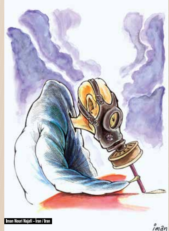
Iman Nouri Najafi - İran / Iran