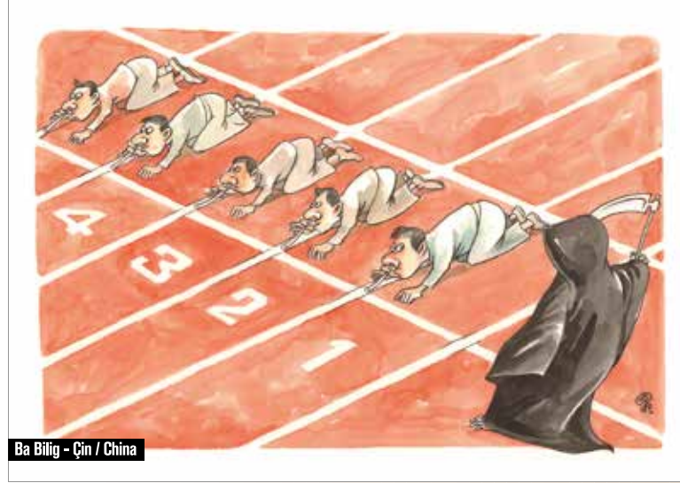
Ba Bitig - Çin / China