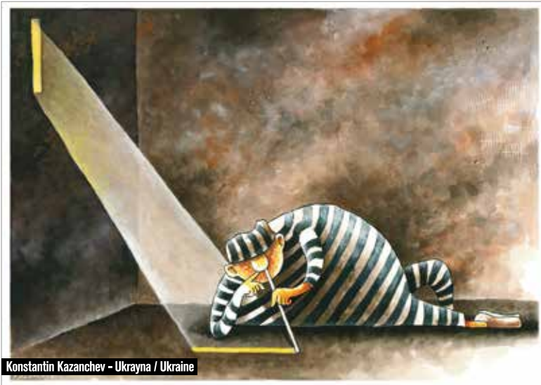
Konstantin Kazanchev - Ukrayna / Ukraine