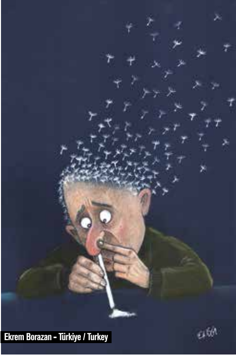
Ekrem Borazan - Türkiye / Turkey

Uluslararası Yeşilay Karikatür Yarışması eserlerinden seçilmiştir.